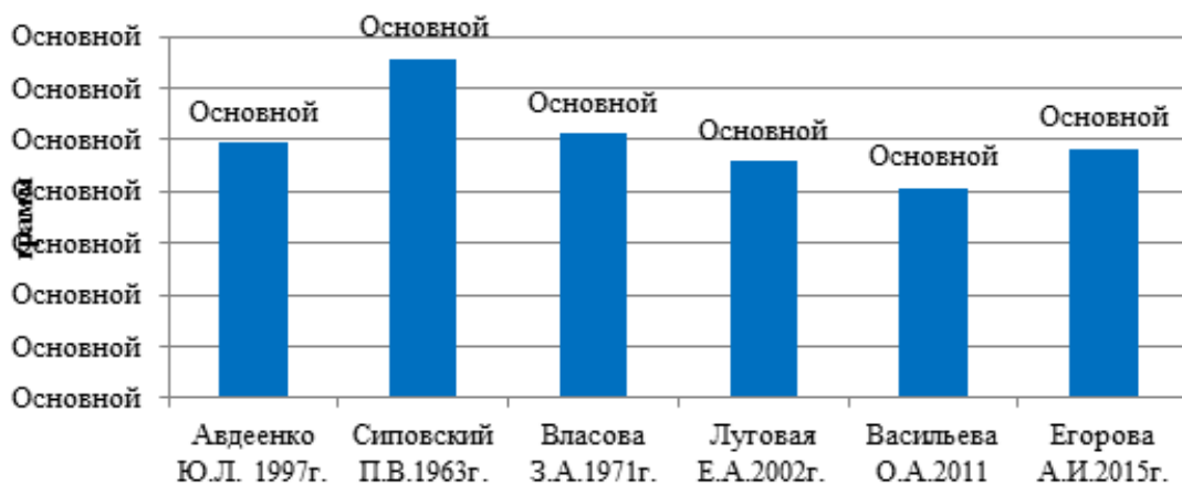
Рисунок 1. Сравнительный анализ показателей средней абсолютной массы щитовидной железы (г) с данными других авторов

Мы предприняли попытку сравнения средних показателей АМ ЩЖ коренных и некоренных жителей Республики Саха (Якутия) с данными Сиповского П.В. (1963), Власова З.А. (1971), Авдеенко Ю.Л. (2003), Луговой Е.А. (2002), Васильевой О.А. (2011). Как видно из рис. 1, отмечается значительная разница в массе щитовидной железы с данными Сиповского П.В. (1963) и незначительная разница с данными других авторов.